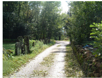
Ci-dessus, le sentier des Hautes futaies à Rouairoux.

Dès que ces différents travaux auront été réalisés, les sentiers de la Haute Vallée du Thoré seront présentés pour l'obtention de l'agrément « PR » (Petite Randonnée). Cet agrément apporte une reconnaissance de la qualité du sentier et une meilleure publicité dans les divers topoguides.