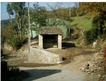
Ci-dessus, le lavoir de Lavergne à Rouairoux.

Depuis déjà deux ans, la CCHVT emploie régulièrement des jeunes de 16 à 25 ans en contrat d'accompagnement vers l'emploi, en partenariat avec la mission locale du Tarn-Sud. La communauté, avec l'aide des communes, fournit un travail d'entretien ou de rénovation soit d'un ouvrage public soit de petit patrimoine bâti. La mission locale suit le parcours de ces jeunes et travaille sur leur savoir-faire et savoir-être afin de les professionnaliser et de leur permettre de trouver un emploi durable.